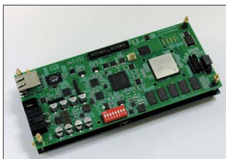
Рис. 1. Плата универсальной SDR-платформы компании Promwad

С точки зрения потребителя, SDR-платформа — это мультистандартное устройство, которое способно работать в любой сети с минимальными настройками, без участия пользователя. На пересечении интересов разработчика и потребителя